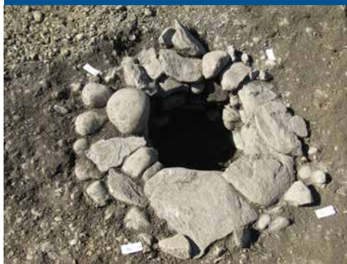
Détail fouilles : puits