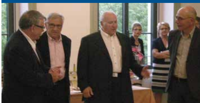
Le président remercie les personnalités