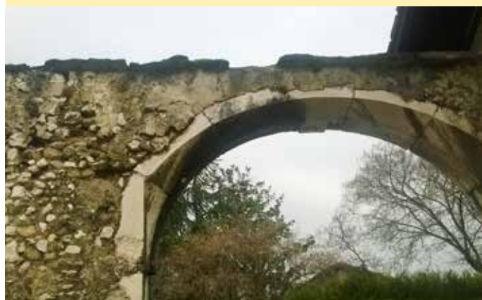
Le porche côté cour