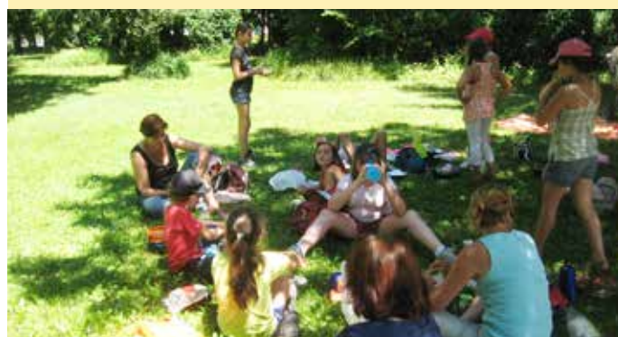
Mâîtres et élèves en pique-nique