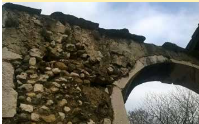
Vue de l'intérieur côté cour