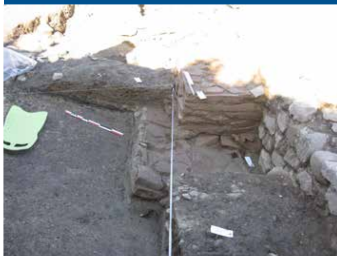
Fouilles : détail