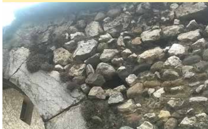
Côté droit du porche