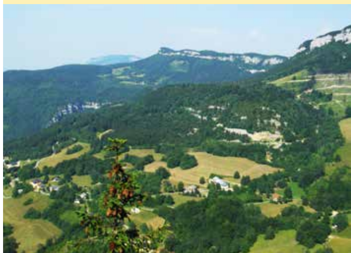
Malleval vue d'en haut

Revue spécifique proposée dans le cadre du programme scolaire « l'histoire ».