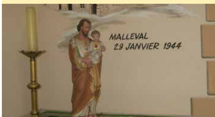
L'intérieur de l'Église de Malleval (côté gauche)