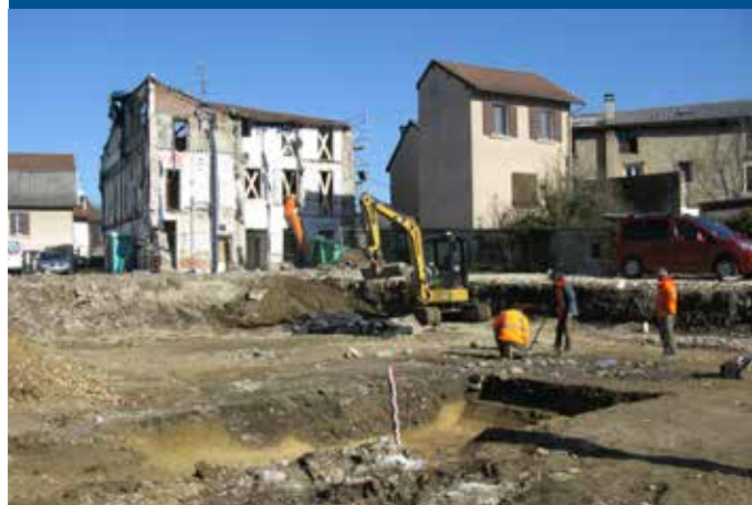
Fouilles sur chantier 119 rue de la République