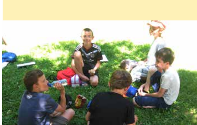
Ecoliers en pique-nique