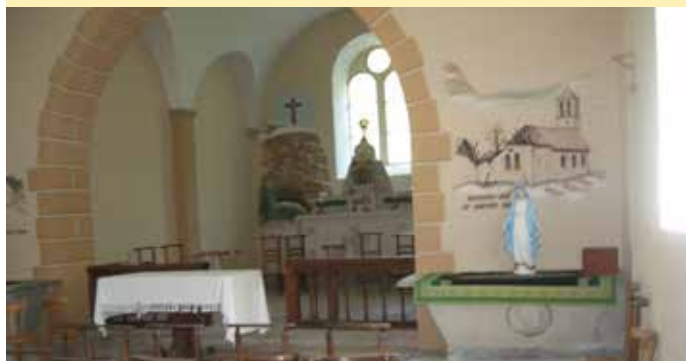
L'intérieur de l'Église de Malleval (côté droit)