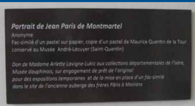
Engagement de prêt du tableau original

Merci à vous tous d'être présents et de bien faire autour de vous, la promotion de ce portrait d'un Moirannais illustre.