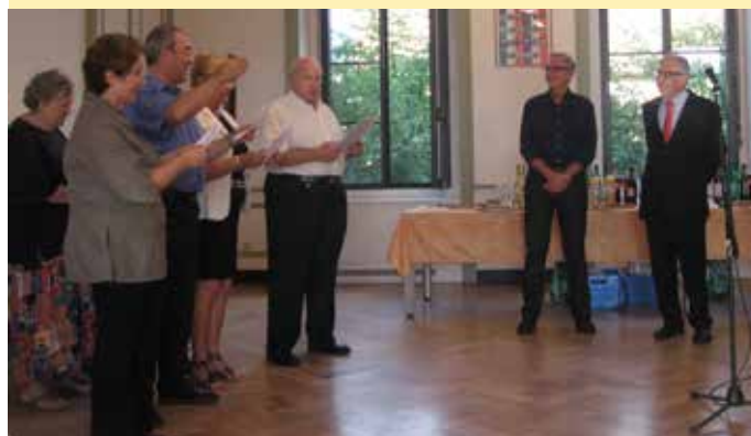
Les membres poussant la chansonnette