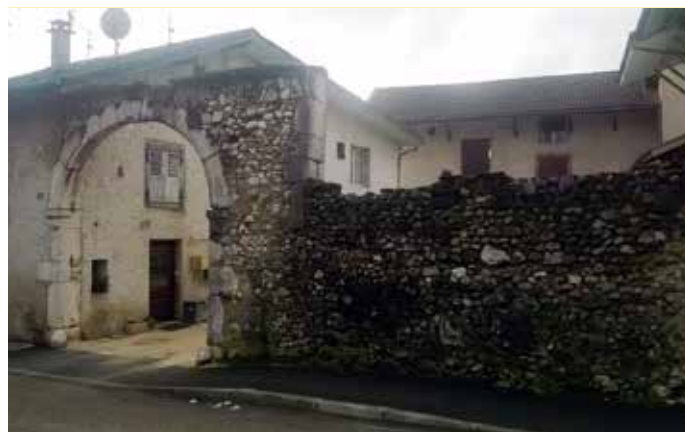
Porche et mur attenant