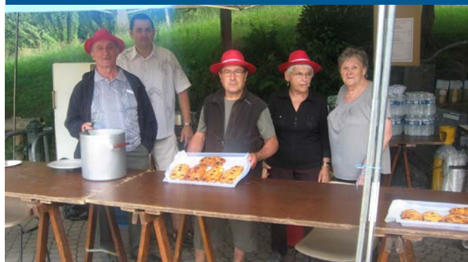
Stand Parc Martin