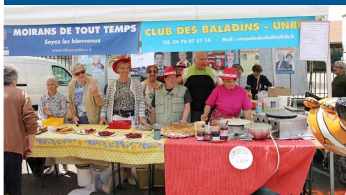
Stand centre ville

Depuis plusieurs années M.T.T. participe à «Cerises en fête» en vendant ses ouvrages. Cette année, l'association a voulu aller plus loin et s'est associée au Club des Baladins pour tenir 2 stands, l'un au parc Martin et l'autre au centre ville. Outre le plaisir de «collaborer» avec une association moiranaise, cela a permis de recueillir quelques fonds supplémentaires pour les 400 ans de l'Auberge des frères Pâris.