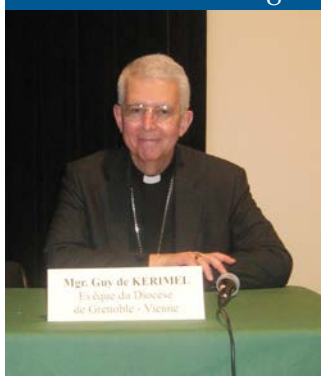
Monseigneur Guy de Kerimel

Les responsables de Moirans de Tout Temps ont accueilli 105 personnes pour le déjeuner, 130 pour les conférences et 160 lors de la visite des deux Eglises.